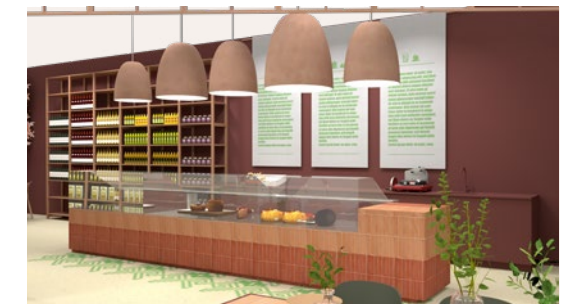
Grafik af Tapas Haven / Risom Design